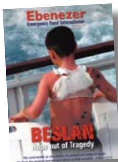
Tapa frontal del Boletín 2004

Beslan, Septiembre de 2004. El mundo se horrorizó ante la toma de una escuela y la toma de rehenes de más de 1.000 niños, maestros y padres. A esto le siguió un sitio de tres días, en el que más de 320 personas, la mayoría de ellos niños, fueron asesinados y cientos de personas resultaron heridas. Después de esta atrocidad, trabajadores de Ebenezer se dedicaron a encontrar y ayudar a las personas Judías que se vieron afectadas por la tragedia. Así fue que ellos encontraron a la familia Israilov, Nelly y sus dos hijos.