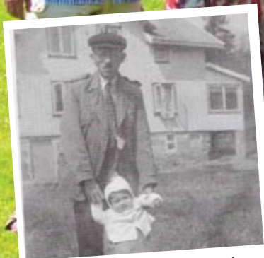
Dos refugiados Judíos al lado del mismo edificio durante la Segunda Guerra Mundial.