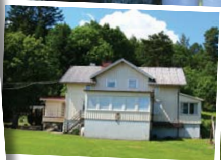
El mismo edificio en la actualidad.